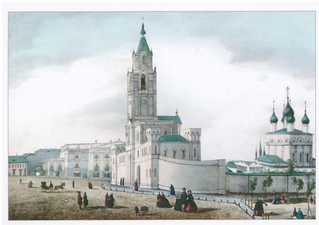
Рис. 1. Страстной монастырь. Литография по рисунку А. Феррари. 1860 г.

Сегодня можно говорить о развитии технологий семантического 3D-моделирования объектов культурного наследия, имеющих целью представление культурного контента новым аудиториям инновационными способами (через развитие новой цифровой среды, приложений и сервисов для цифровых ресурсов архивов, музеев, библиотек).