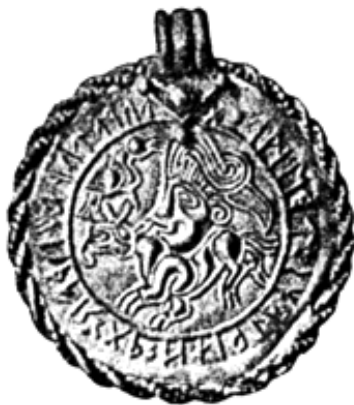
Рис. 2. Брактеат с портретом вождя (изображением Одина?) и руническим текстом из Вадстены (Швеция)

Принимая во внимание, что в рассматриваемый период еще не было нарушено единое древнегерманское языковое пространство, не удивительно, что из западной Германии руны распространились на север и на восток, положив начало готским рунам, где футарк также использовался исключительно военной знатью как своего рода тайнопись. В середине IV в. креститель готов Вульфилла, опираясь на руническую письменность, греческий и латинский алфавиты создал полноцен-